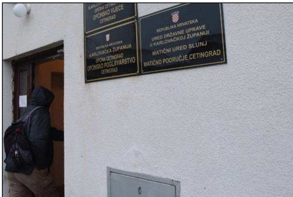
Zgrada Općine Cetingrad u kojoj se posljednjih godina zbio niz nepravilnosti